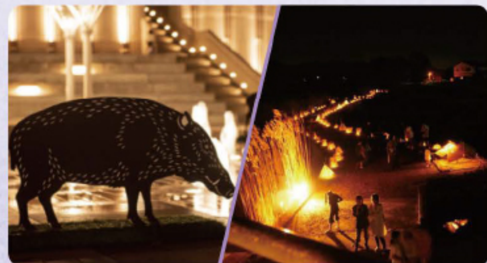
おごと温泉観光公園