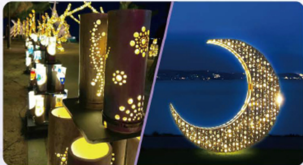
なぎさ公園 (打出浜)