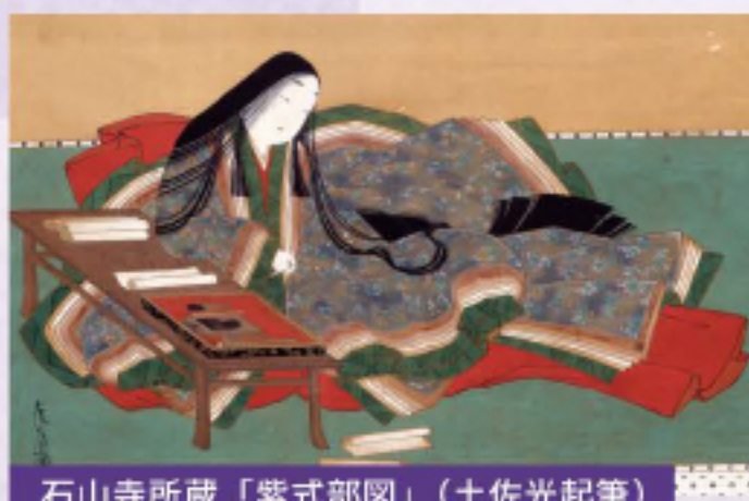
石山寺所蔵「紫式部図」(土佐光起筆)

百人一首五十七番 【紫式部】 めぐり逢ひて 見しやそれとも わかぬ間に 雲がくれにし 夜半(よは)の月かな