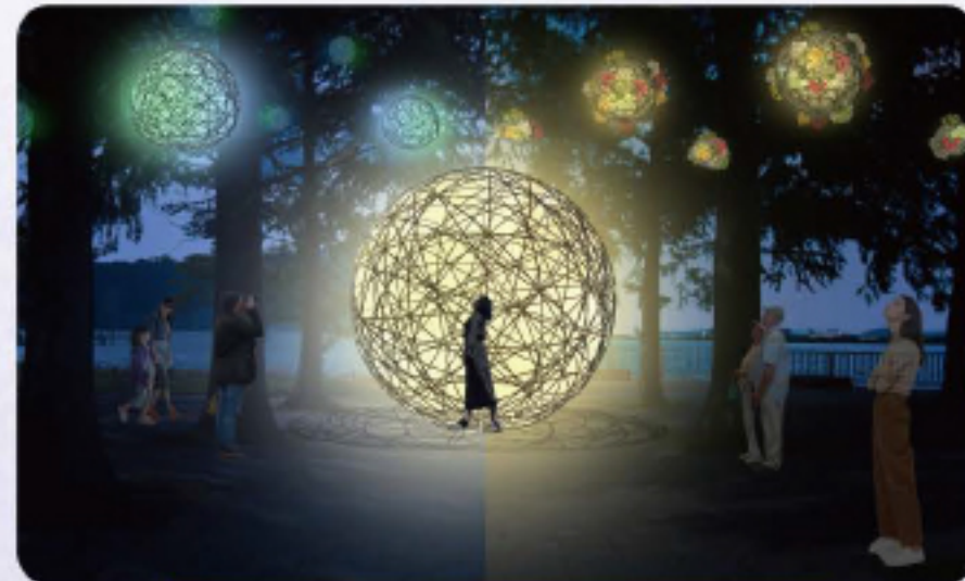
なぎさ公園 (におの浜)