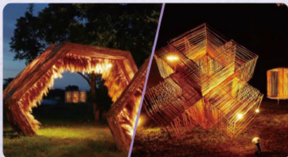
道の駅 びわ湖大橋米プラザ